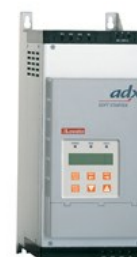
Softstart ADX...B Asynchroniczny trójfazowy